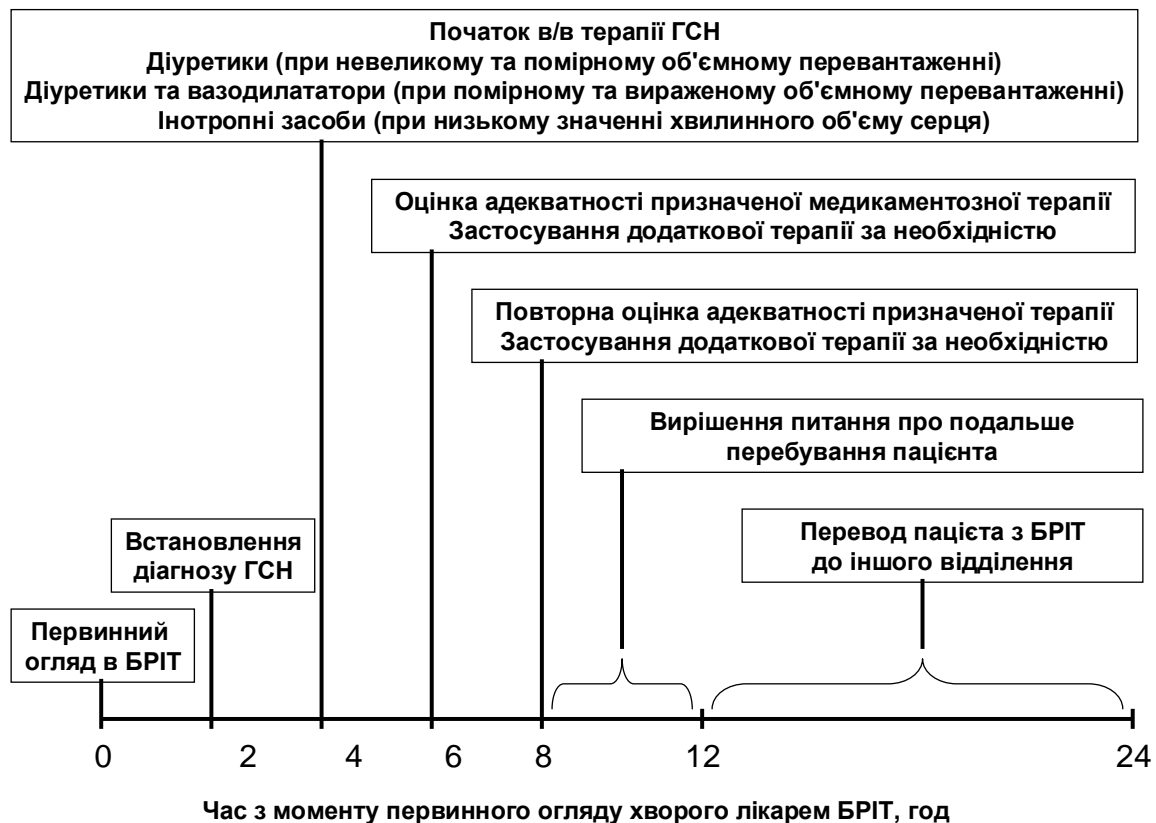
Рисунок 2. Рекомендована послідовність втручань в блоці реанімації та інтенсивної терапії при гострій серцевій недостатності.